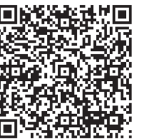
厚生労働省 ホームページ